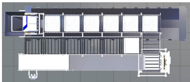
連続洗濯機の上から見た図