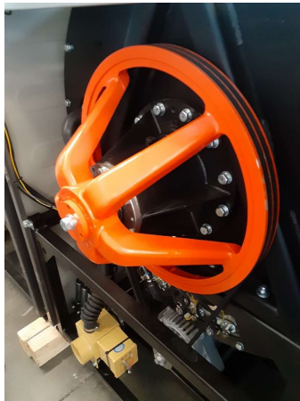
アルミ合金製プーリーを採用、アルミの軽量さで 主軸に負荷かけず、メン テナンスフリーに寄与