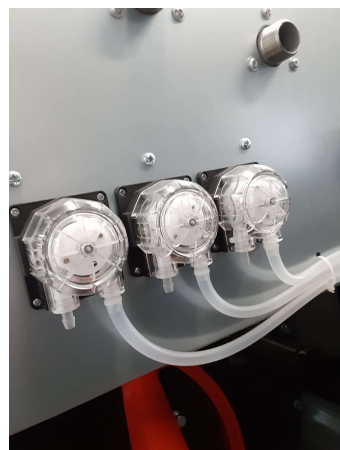
洗剤自動投入機で全自動 洗濯可能で手間いらず、 洗剤の供給も可能 (OP)