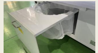
引出し式リントフィルター採用。掃除が簡単です。