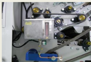
チェーン自動給油