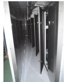
機械内部のメンテ用ドア