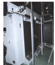
仕上ゾーンメンテ用ドア